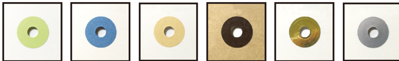
緑 青 薄茶 こげ茶 金・銀紙 金・銀フィルム